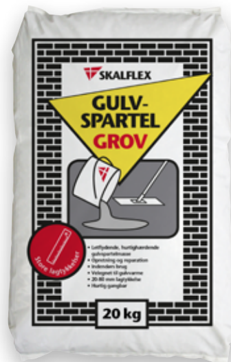
20 kg, DB-nr: 1840039